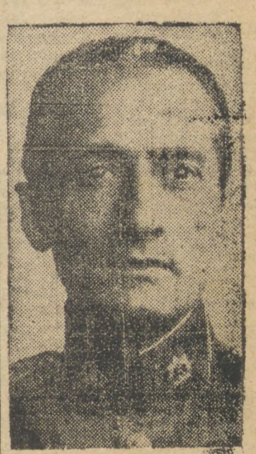
General José Pessoa