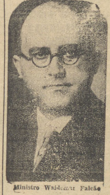
Ministro Waldemar Falcão

RECIFE, 27 (D.) — Chegou hoje a esta capital, acompanhado de varios membros de seu gabinete, o Ministro do Trabalho, sr. Waldemar Falcão, o qual teve uma festiva recepção.