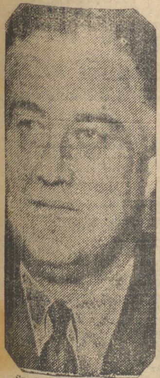
Sr. Franklin Roosevelt

O Presidente Roosevelt Obteve Grande Maioria Na Votação Do Senado — França e Inglaterra Beneficiadas