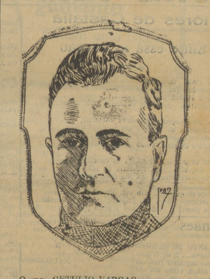
O sr. GETULIO VARGAS, que apresentou a candidatura de si mesmo, por não querer largar do poder.

mas de guardas-civís. Externamente havia tambem uma reforçada vigilancia policial. O acesso ao interior tornou-se muito difficil e só era permitido as pessoas munidas de cartões especiaes para a sessão de hoje e ás familias acompanhadas de deputados ou outras autoridades de destaque.