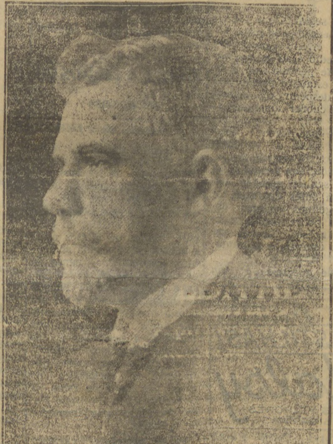
O sr. Washington Luis, que apresentou a candidatura do sr. Julio Prestes, para ser substituido no poder.