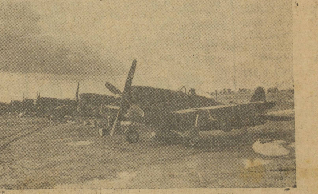
JANEIRO — S.I.H. UMA ESQUADRA DE CAÇA DA FAB QUE ESTA OPERANDO NA ITALIA.