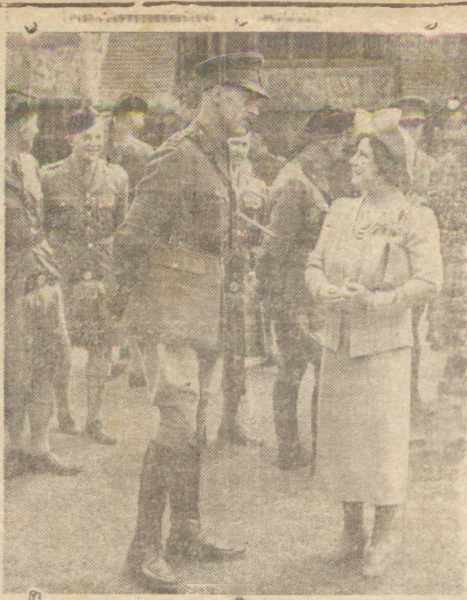
S. M. A RAINHA ELIZABETH VISITA O "LONDON SCOTTISH". — S. M. a Rainha Elizabeth, Coronel Honoraria do Regimento de Escoceses, fez, ainda recentemente, uma visita a um dos batalhões do "London Scottish". Na fotografia acima, vê-se a Rainha palestrando com os oficiais durante a conversação que manteve com os oficiais daquele famoso Regimento.

O PROXIMO JOGO — O próximo jogo dos brasileiros será no próximo sábado, contra o forte esquadrão representativo do futebol do Uruguai.