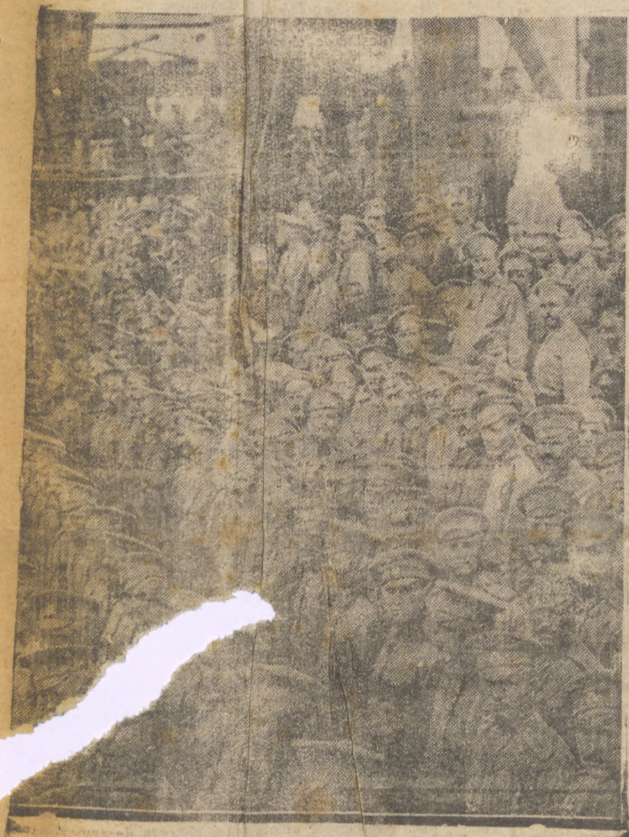
ESTA GUERRA NÃO PODE LEVAR DE INVOCAR A OUTRA DE 1914. O NOSSO CLICHÉ MOSTRA TROPAS RUSSAS CHEGANDO A FRANÇA NAQUELA EPOCA, PARA COMBATER CONTRA A ALEMANHA

A IMPORTANTE CIDADÊ HINEIRA SERA' O PROXIMO OBJETIVO DOS FRANCESES — AVIÕES ALIADOS ABATIDOS PELOS GERMANICOS