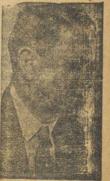
Interventor MANOEL RIBAS

Divulga-se no Rio que, "no sistema de acordos para o fomento da produção vegetal firmado entre o Ministério da Agricultura e 16 governos e Estados, os serviços articulados no Paraná figuram entre os mais eficientes". As cifras que nesse estado são alhadas, com referência apenas à distribuição de sementes que a Seção de Fomento Agrícola, sediada em Curitiba fez no ano passado evidenciam de maneira eloquente o vulto desse trabalho de preparação que vem produzindo os melhores resultados na seus objetivos de promover o engrandecimento das nossas fontes de riqueza provinda do solo generoso do Paraná. Os campos de multiplicação de sementes, com extensas áreas cultivadas, vem realizando com crescente eficiência suas finalidades, com o fornecer sementes de boa qualidade aos nossos lavradores para a melhoria e ampliação das diversas culturas. O trabalho de cooperação desenvolvido em virtude do acordo entre o Estado e o Ministério da Agricultura tem sido, como se vê, dos mais profícuos e os seus resultados demonstram, à evidência, o acerto da orientação adotada por força do qual se estabeleceu esse sistema, uma feliz inspiração do governo do sr. Getúlio Vargas.