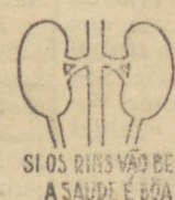
SIOS RINS VÃO BEM A SAÚDE É BOA

Felizmente existe á mão o remedio providencial: HELMITOL de Bayer. A sua acção sobre o aparelho renal é rápida e segura. Limpando e desinfetando os rins, HELMITOL garante o bem-estar atual e uma velhice sadia e livre de achaques.