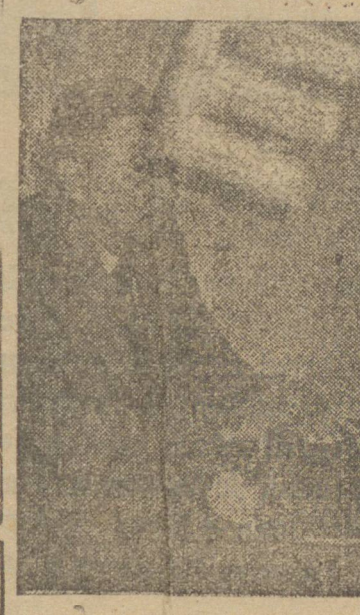
INTERVENTOR MANOEL RIBAS

Como parte integrante das comemorações levadas a efeito na data de hoje, em homenagem ao 25º aniversário da fundação de Curitiba, realizou-se ás 10 horas da manhã, em expressiva cerimonia, a inauguração oficial da nova sede da Associação de Puericultura do