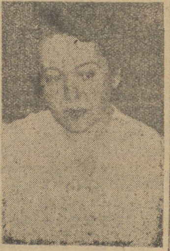
EXMA. SRA. D. DARCI VARGAS