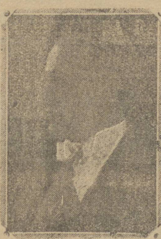
PRESIDENTE GETULIO VARGAS

Competente, com 25 anos de pratica, oferece-se. Informações nesta redação.