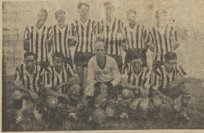
O velente esquadrao alvi-negro

Haverá trem especial para Officinas, com partida á hora habitual, da gare ferroviaria, isto é, ás 14,30 horas.