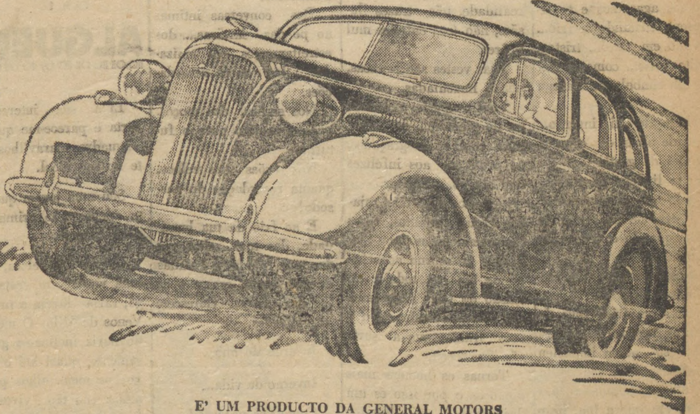
E' UM PRODUCTO DA GENERAL MOTORS

NOVA CARROSSERIA INTEIRAMENTE DE AÇO. — Silenciosa como uma estrella no céu, a carrosseria Uni-Steel, inteiramente de aço, do novo Chevrolet, oferece mais conforto e segurança e é mais espaçosa, porque o motor foi posto mais à frente. Nella, ha assentos mais amplos, portas e janellas mais largas, e não ha tunel, quebrando a harmonia do soelho. E ha mais: freios hydraulicos aperfeiçoados, Acção de Joelho, Engrenagens Hypoid, e outras vantagens que tornam o Chevrolet, mais uma vez, o dominador das estradas e ruas.